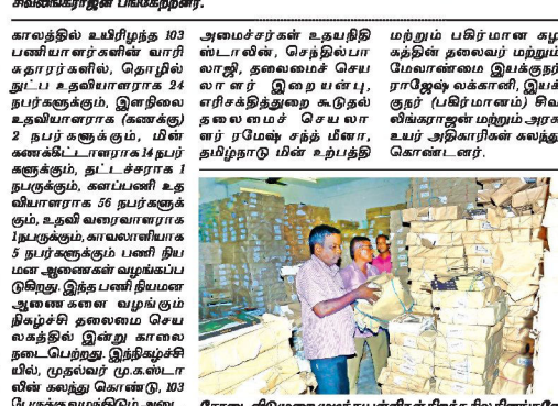
கோடை விடுழு pறை முட நில், செ உள்ள நிலையில் மகளிர் மேல் நில சென்னை சிந்தாதிரிப்பேட் லப்பள்ளியில் உள்ள கிட பட்டைகலயான் எகிடங்கில் இருந்த 6 முதல் பிளஸ் 2 வகுப்புகளுக்கான பாடப்புத் அனுப்பும் பணி விறுவிறுப்பாக நடந்து வருகிறது